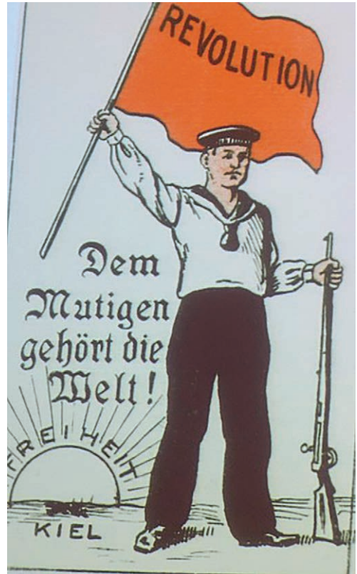
Revolutionspostkarte 1918, anonym