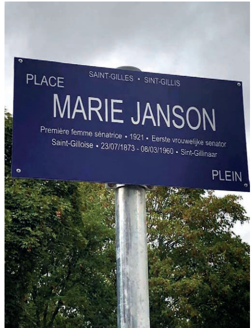
Tafel am Place Marie Janson in Saint-Gilles, Belgien