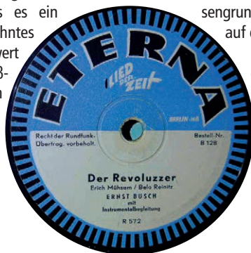
Radiophon-Matrize R 572 auf ETERNA (www.albis-international.de)

Ernst Busch liebte diese bissige Satire Erich Mühsams auf die halben Portionen, die sich Revolutionäre nannten, aber nicht die Hände schmutzig machen wollten. Busch zweifelte nicht an der Notwendigkeit einer konsequenten Veränderung gesellschaftlicher Zustände, auch der Eigentumsverhältnisse. Diese Auffassung vertrat er auch in Bezug auf sein eigenes Unternehmen.