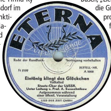
Matrize ET 2109, Bestell-Nr. Et 5000, eigens f. ETERNA hergestellt (www.albis-international.de)