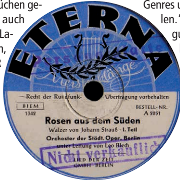
Bald wurden auch die Operettenmelodien verwertet. Matrize 1342, ursprüngliches Label Pallas (www.albis-international.de)

Busch, „Lied der Zeit“ und dem Berliner Rundfunk die Grundlagen für eine geordnete Plattenproduktion gelegt. 2 Busch-Aufnahmen für den Funk einerseits und die Schallplatte andererseits werden nun möglichst eindeutig gekennzeichnet, um ein Kuddelmuddel in der Finanzabteilung des Berliner Rundfunk zu vermeiden. Wenige Tage nach Vertragsschluss beginnt Busch mit den Aufnahmen zu einer neuen Produktionsreihe für die Schallplatte, „Internationale Arbeiterlieder“. Diese wird am 4. Februar 1948 eröffnet mit den Proben zu „Marsch der